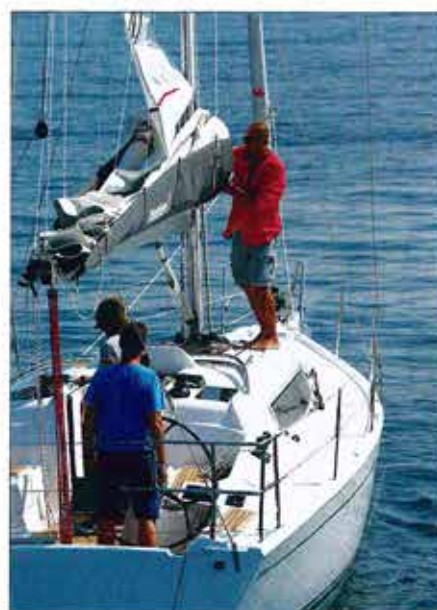
▲ Un bateau à taille humaine, ce sont aussi des manœuvres plus faciles... Tout est accessible.