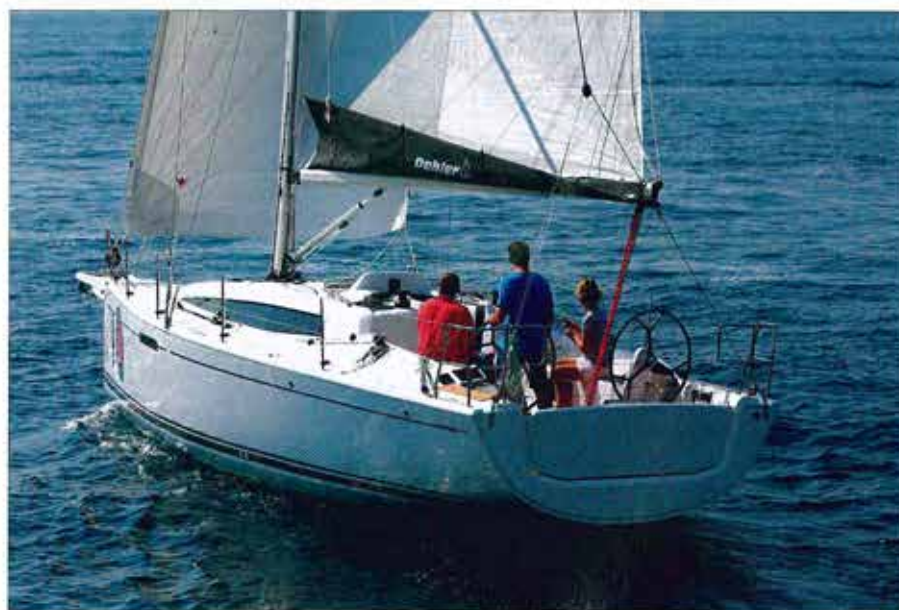
▲ Plateforme de bain relevée, le cockpit est bien protégé, défendu sur les côtés par des hiloires bien proportionnées qui suivent une courbe douce jusqu'au passavant.

« Tous les attributs d'un course-croisière sur 10 m de coque : pari tenu pour le Dehler 34. »