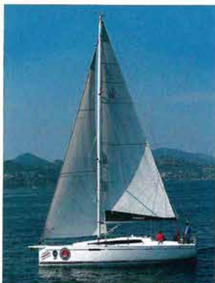
▲ Nous avons le gréement standard, mais il existe une version à mât plus long (6 m 2 de plus).