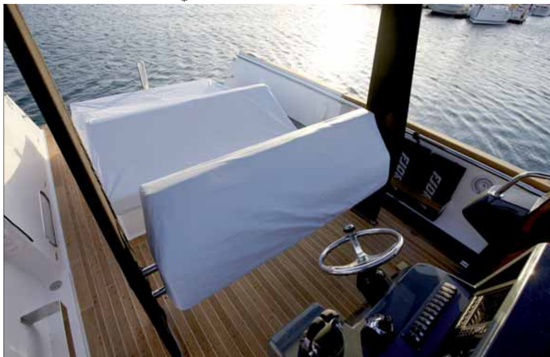
▲ El puesto de gobierno, protegido del sol por un toldo bimini, proporciona un asiento de pilotaje de tipo leaning post.

La cocina queda situada en el lateral ▶ de babor del interior con una práctica nevera de apertura frontal.