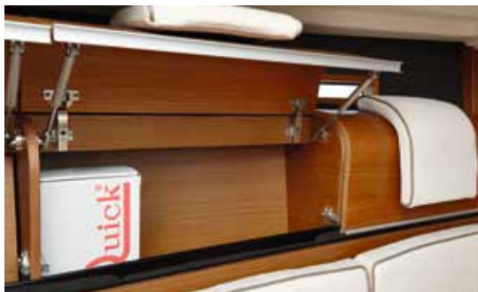
De dybe skabe i borde er praktiske til søs, fordi indholdet ikke så let falder ud, når båden krænger. Bemærk de smarte nakkepuder på lugerne.