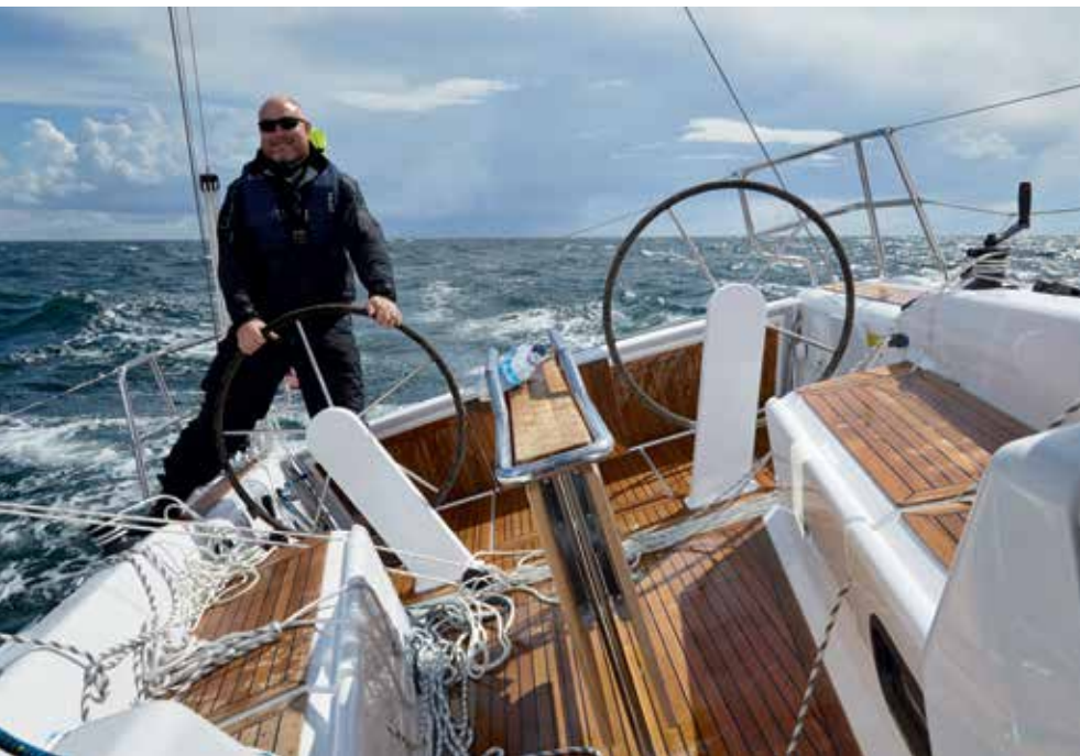
Dehler 38 er en tør båd at sejle. Her er cockpittet vådt af regn. Det var kun få "vaskere", under 11 timers sejlsads i høj sø.