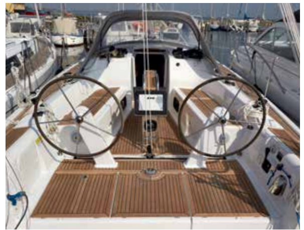
Cockpittet er dejlig stort og funktionelt med forsænket løjgang og trimfunktioner tilpasset små besætninger. Testbåden var ekstraudstyret med fast og solidt klappbord og sprayhood med stor frontrude.