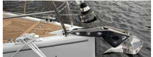
Rulleforstaget har tromle over dækket, så forstag og mast kommer længst muligt frem i båden. Det giver bedre plads i salonen. Bemærk det rustfrie anker.