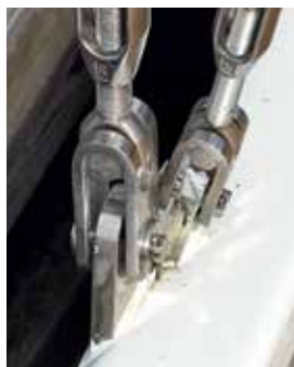
Vantene er praktisk og solidt placeret ude i en indstøbt reces i fribordet.

Her har Dehler ikke prøvet at peppe båden op med smarte ting, der kun gør sig godt på en udstilling. Her fungerer alt.