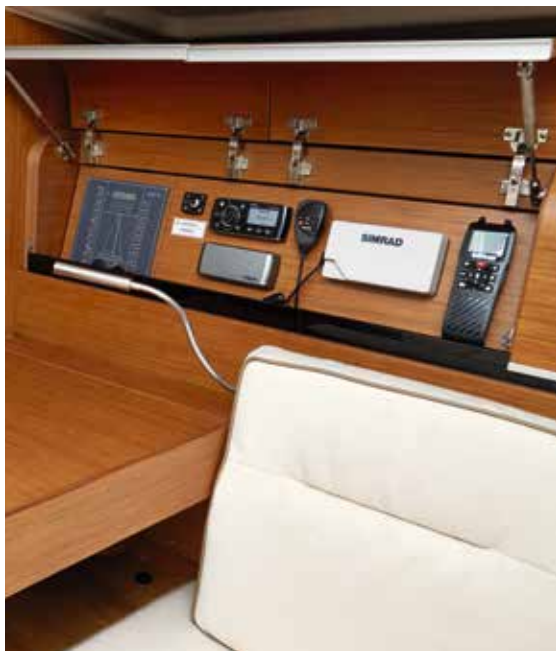
El-panel og instrumenter kan skjules med tophængte luger. Kortbordet er praktisk placeret på skinner, så det kan skubbes fremad som et ekstra kaffe- eller læsebord om bagbord.