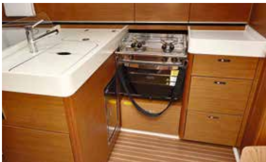
Traditionel pantry, udrustet med en stor 130 liters køleboks, der åbnes fra toppen og med en køleskabsdør i rustfri stål nederst i køleboksen.