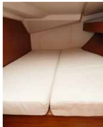
Der er fin plads i dobbeltkøjerne agter. Her om bagbord i testbåden var der adgang via et badeværelse. Som standard er der et stort stuverum her. Toilet og brusebad er placeret adskilt fra vaskebord, skabe og spejle.