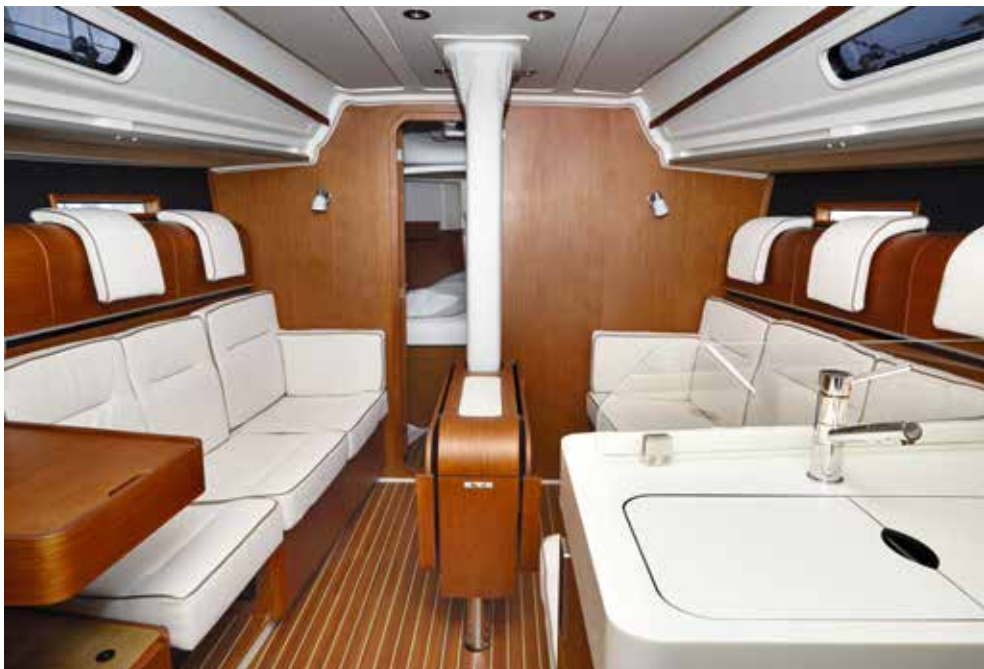
Salonen er traditionelt og praktisk indrettet, med en spændende og forfriskende apering i teakfiner fra italienske Alpi. Der er mange valgmuligheder for polster på hynder og nakkepuder. Bemærk håndlisterne i knækket mellem ruf og dæk. De fungerede fint ude til søs.