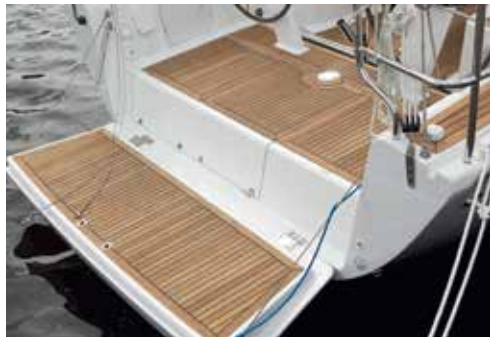
Den normalt lukkede hæk kan vippes ned som badeplatform. Det giver mulighed for at åbne stuverummet til en redningsflåde om bagbord, så flåden kan trækkes direkte ud i vandet over platformen.