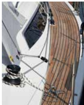
Fokkens skødeskinne er trukket helt ind til ruffet, og vognen kan praktisk trimmes trinløst fra cockpittet. Bemærk at dækket er meget rent og at vantene er flyttet helt ud i borde.