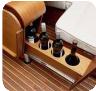
Der er barskab i salonbordet, som man kan komme til gennem det hvide plade i bordpladen eller ved at trække baren ud som en skuffe.

Selve indretningen er helt enkel og gennemprøvet i generationer af både, med gode gribelister i hver side, så båden også fungerer om læ, når man er ude til søs.