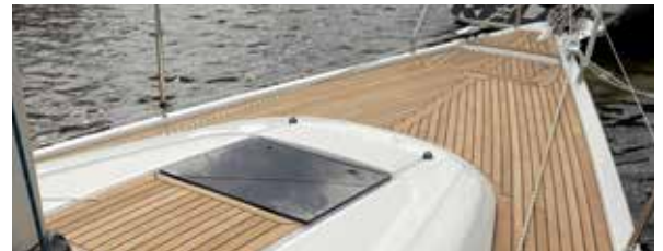
Forlugen er i niveau med ruffet, fald og trimliner er diskret ført ned til cockpittet under en kappe på ruffet og fordækket er helt rent, med en ankerbrønd i stævnen.