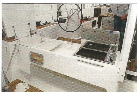
▲ Le banc arrière du cockpit cache une vraie cuisine avec évier, glacière et planche de cuisson !