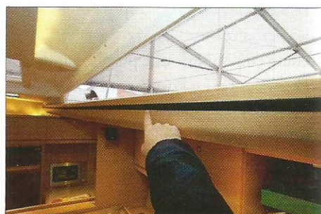
▲ Les mains courantes en bois sont habillées par un élégant insert en cuir.