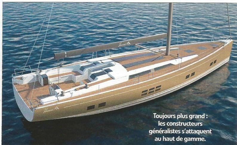
Toujours plus grand : les constructeurs généralistes s'attaquent au haut de gamme.

Long. : 20,12 m. Long. flot. : 20,12 m. Largeur : 9,40 m. TE : 1,30-3,60 m. Dépl. : 19 000 kg. SV au près : 300 m 2 . Génois : 165 m 2 . GV : 135 m 2 . Mat. : carbone/PVC. Arch. : VPLP. Const. : Marsaudon Composites. Prix : nc.