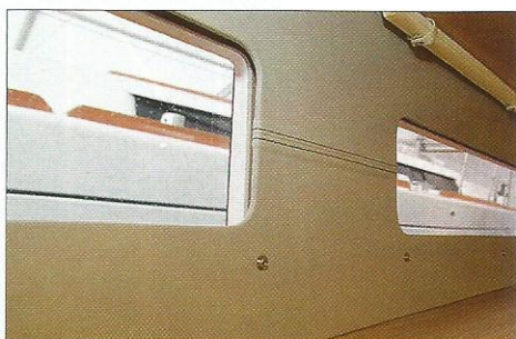
▲ On retrouve du cuir sur les vaigrages du bordé. Avec une surpiqûre pour rappeler la sellerie.