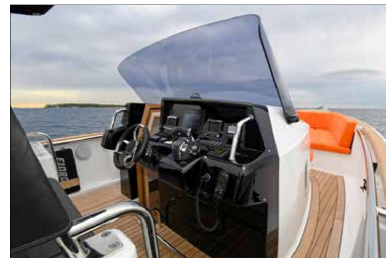
La marque allemande s'est toujours distinguée par ses consoles de pilotage très travaillées. Celle du 36 ne déroge pas à la règle.