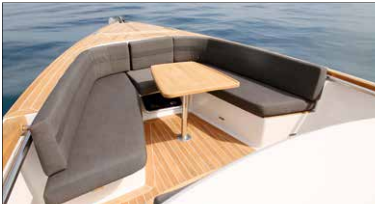
La plage avant est occupée par un confortable carré en U encadrant une seconde table.