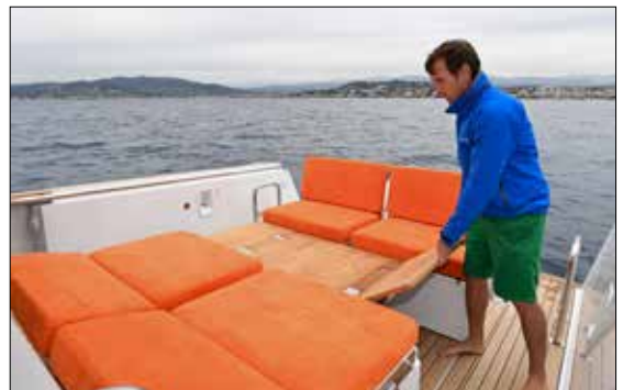
En version hors-bord, les deux banquettes du cockpit peuvent se transformer en un bain de soleil, impossible à bord de l'in-board.

de circulation dans le sens de la longueur et de la largeur du bateau. Dans sa version optionnelle, le cockpit se transforme en un confortable bain de soleil. Outre le ressenti en navigation, la différence la plus notable entre les ►