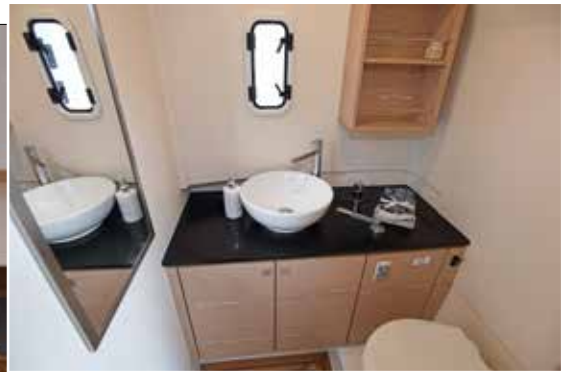
De petites croisières peuvent être envisagées en couple à bord de ce modèle abritant un couchage double et une salle de bain.