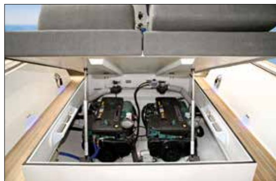
En version in-board, les deux moteurs viennent prendre place sous le cockpit.