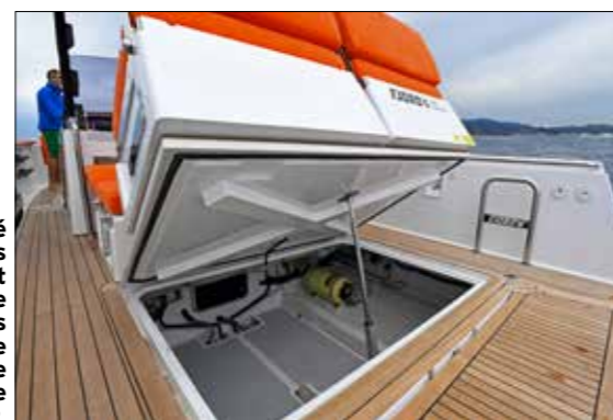
L'espace laissé vacant sous le cockpit par l'absence des moteurs in-board offre un très vaste espace de rangement.