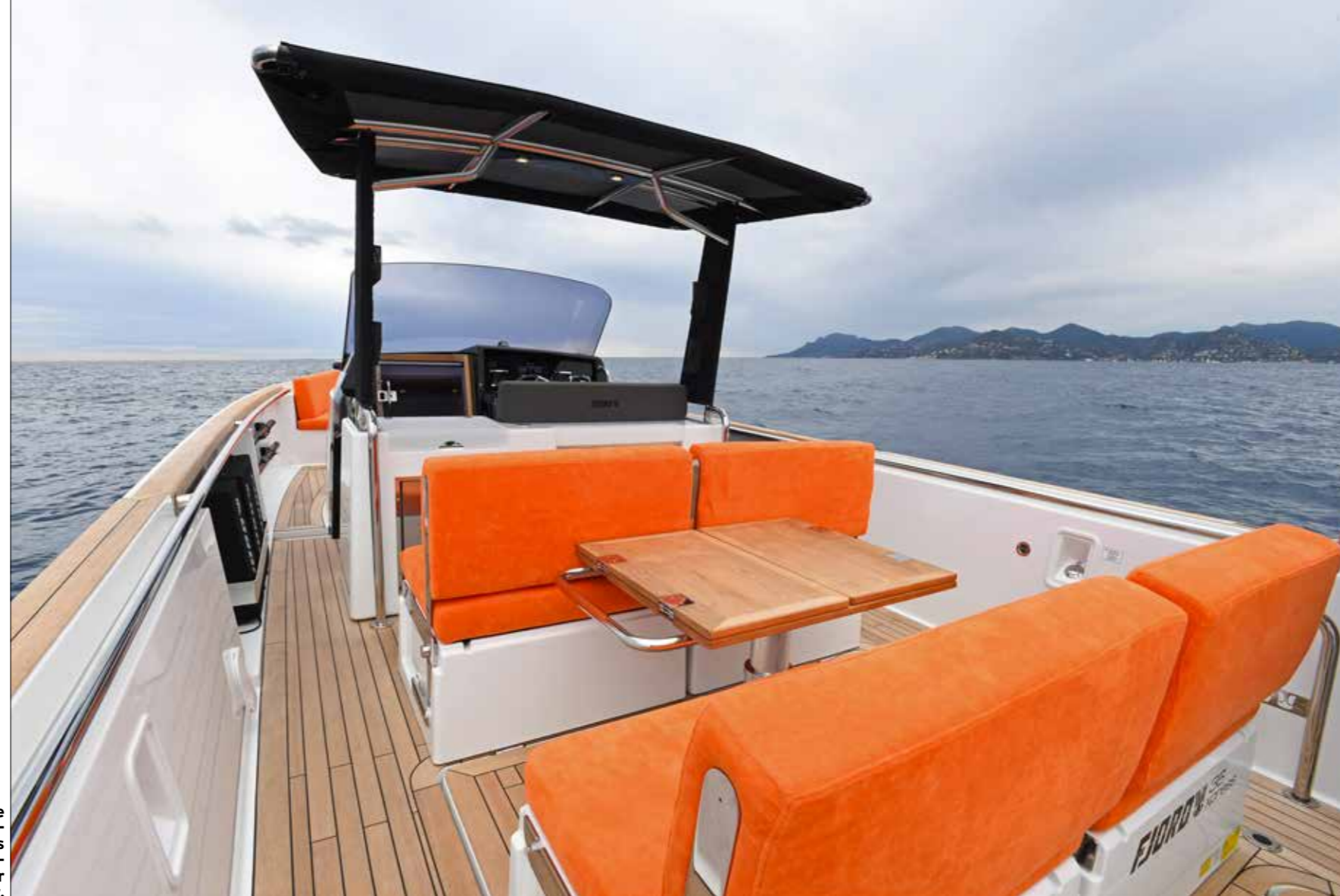
Un Fjord se caractérise toujours par ses axes de circulation en largeur et en longueur.

A u début de la décennie, l'arrivée sur le marché du Fjord 36, trois ans après son grand frère de 40 pieds, avait permis d'imposer la marque allemande sur le créneau de l'open méditerranéen. Surfant sur le développement de moteurs de plus en plus puissants, Fjord décline désormais le plus petit modèle de son catalogue en une séduisante version hors-bord. Une alternative qui permet au constructeur de disposer d'une corde supplémentaire à son arc en allant se poser en concurrent frontal des chantiers proposant des semi-rigides et day-boats haut de gamme propulsés par ce type d'engins.