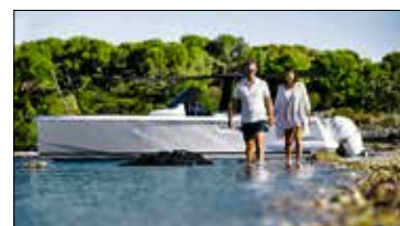
Beacher ou mouiller dans 20 cm d'eau : l'atout maître du 36 Open.