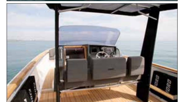
Cet in-board, essayé en version standard, n'était pas équipé de l'option cuisine. Un large espace est laissé vacant sous le T-top.

se montre nettement plus nerveuse en navigation, en conférant au barreur de bonnes sensations en optimisant l'assiette du bateau à l'aide du trim. Soulignons que, de manière générale, le bateau offre un comportement général