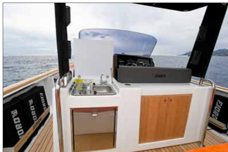
On trouve au dos de la banquette du poste de pilotage un bloc-cuisine avec réchaud, évier et réfrigérateur.

Naviguant donc sur la même carène que le 36 Open d'origine, ce 36 Xpress – dont la longueur hors-tout dépasse de 50 cm celle de la version in-board – fait valoir de nombreux atouts dans ce nouveau type de configuration. À commencer, et ce n'est pas là le moindre des arguments, une facture moins élevée... Car, avec un tarif de base avoisinant 240 000 € (en version 2 x 300 ch), le Xpress se positionne tout de même 75 000 € en dessous de la version in-board propulsée par deux