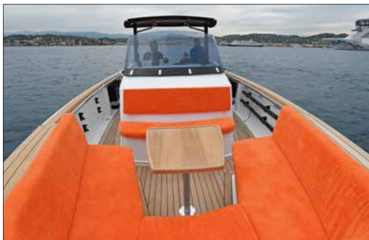
Les hauts pavois sécurisent la circulation tandis que les larges plats-bords offrent des assises tout autour du bateau.